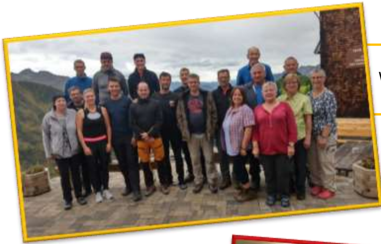
Rückblick CVJM- Wanderwochenende Kaltenberghütte

Abschluss mit Stärkung bei der Nachtwanderung der Jungscharen