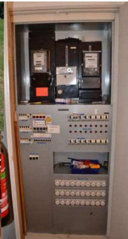
Bilder vom Konfi-Camp, Schaltschrank und Bankheizung in der Kirche, WebCAM auf dem Kirchturm mit Blick auf Talheim und Erntedank-Altar vom letzten Jahr