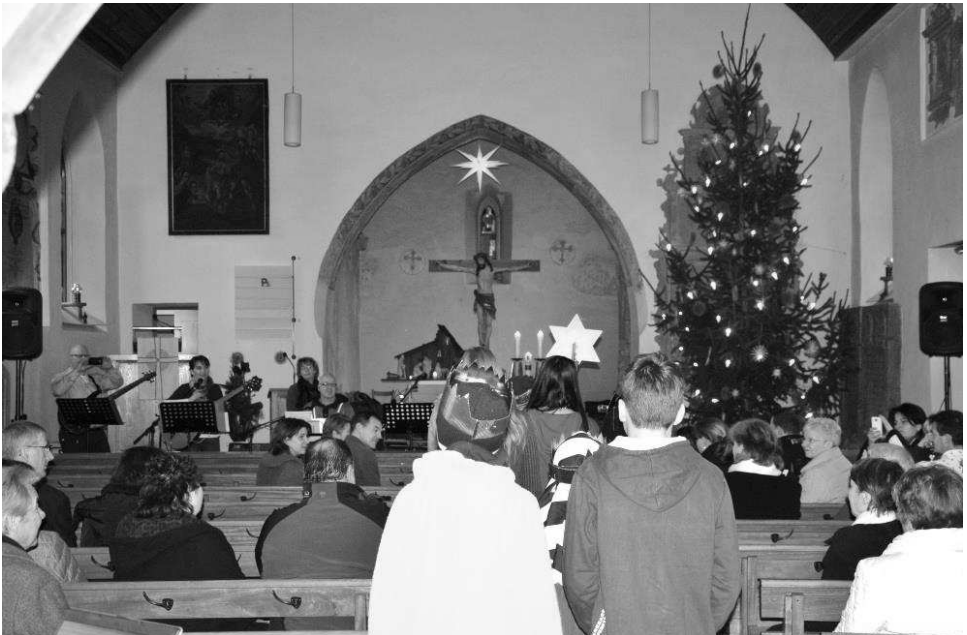
Die Talheimer Sternsinger beim Abschlussgottesdienst in der Bergkirche